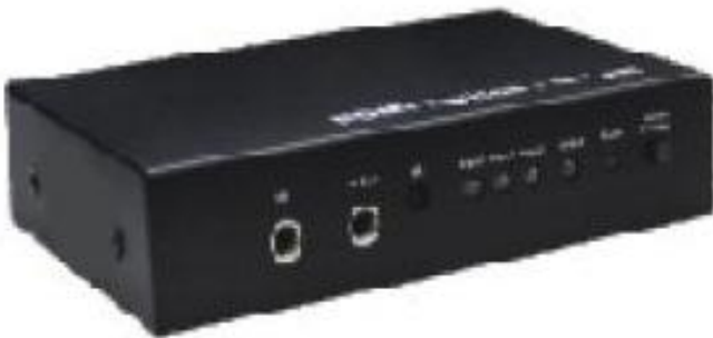
NEXT-0301SW HDMI Switch 3x1