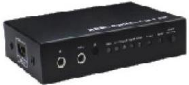
NEXT-0501SW HDMI Switch 5x1